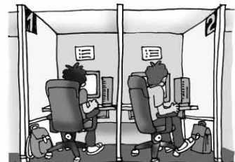
インターネットカフェ