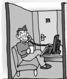
テレフォンクラブ