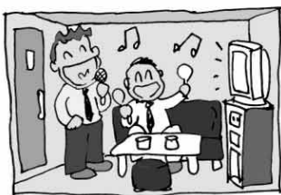
カラオケボックス