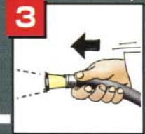
ノズルを火元に向ける