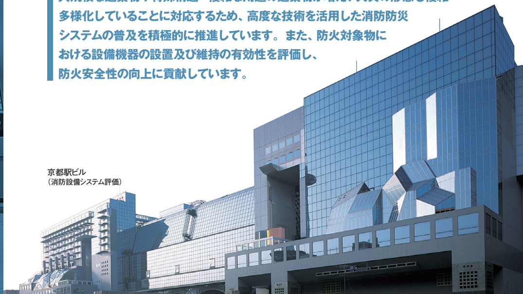
京都駅ビル (消防設備システム評価)

大規模な建築物や特殊構造・複雑な用途の建築物が増え、火災の形態も複雑多様化していることに対応するため、高度な技術を活用した消防防災システムの普及を積極的に推進しています。また、防火対象物における設備機器の設置及び維持の有効性を評価し、防火安全性の向上に貢献しています。