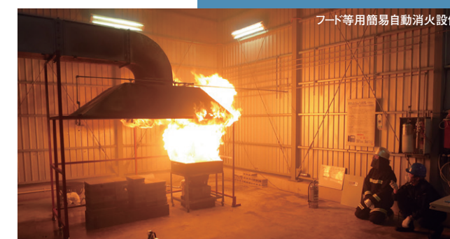
フード等用簡易自動消火設備