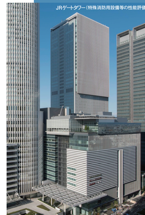
JRゲートタワー (特殊消防用設備等の性能評価)