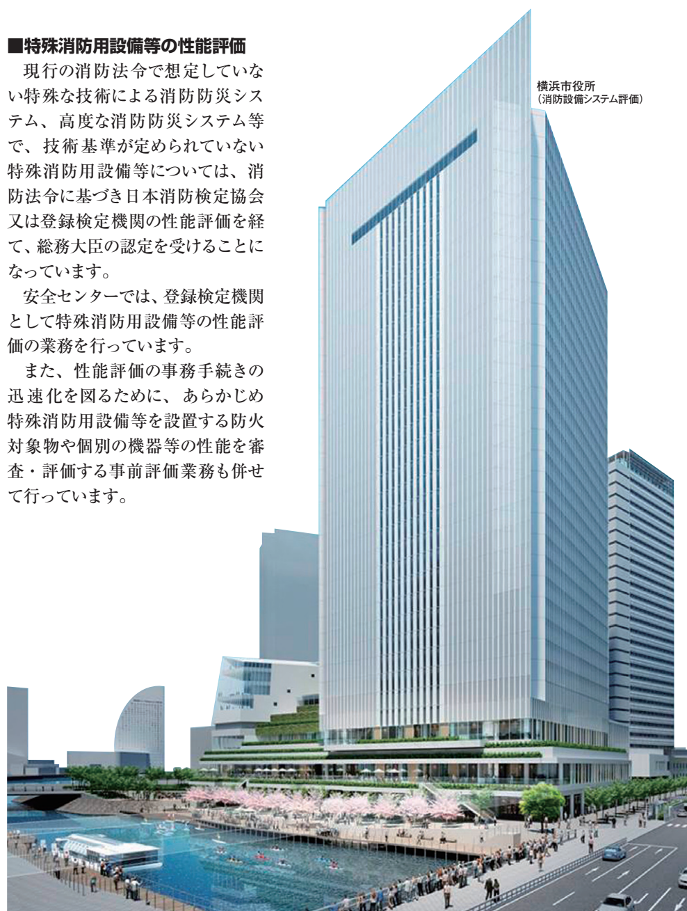
横浜市役所 (消防設備システム評価)

また、性能評価の事務手続きの迅速化を図るために、あらかじめ特殊消防用設備等を設置する防火対象物や個別の機器等の性能を審査・評価する事前評価業務も併せて行っています。