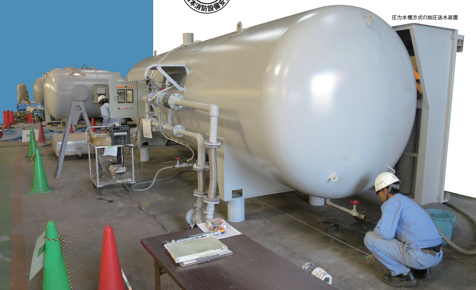
圧力水槽方式の加圧送水装置