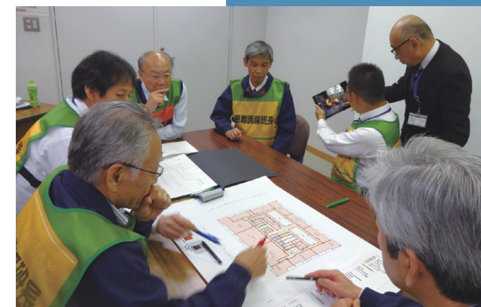
自衛消防業務講習