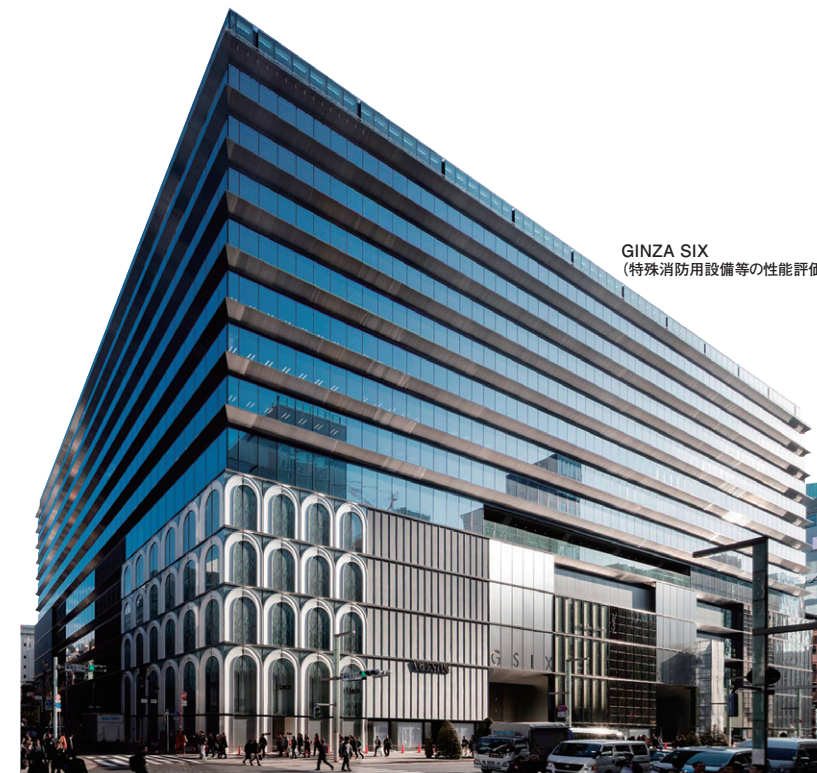
GINZA SIX (特殊消防用設備等の性能評価)