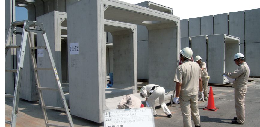
二次製品等防火水槽