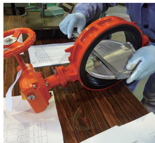
消火設備用バタフライ弁