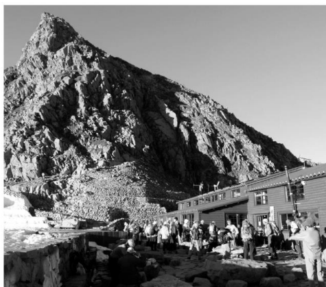
奥穂高の山小屋 ※写真と本事例とは関係ありません。