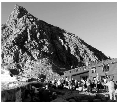
奥穂高の山小屋 ※写真と本事例とは関係ありません。