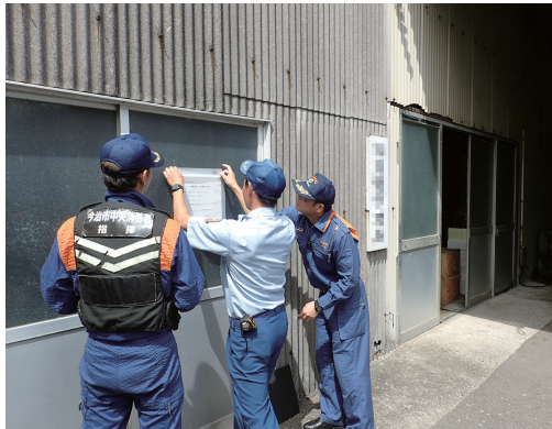
予防課と査察専従員が協力して標識を設置している様子