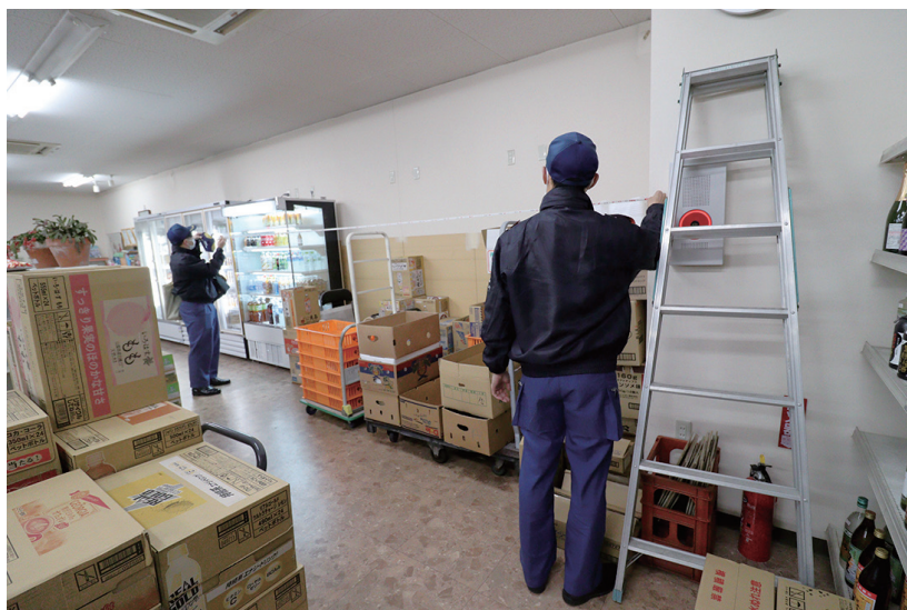
早朝から現場調査をしている様子

警告書は2名に交付していたが、Bが管理権原者にあたるという客観的資料がなく、Aの供述のみでBにも命令して大丈夫なのか？という