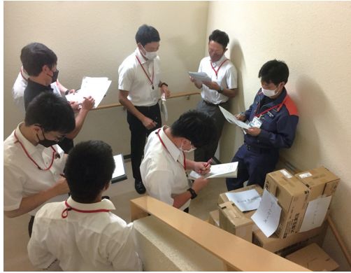
東予地区違反是正研修会

るが、近年では、査察専従員以外の若手職員やベテラン職員から「研修会に参加させてほしい」という要望が増えており、職員の意識の変化を感じている。