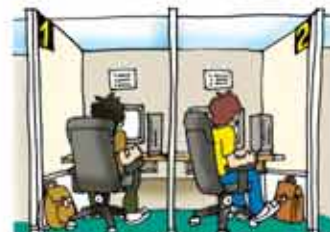
インターネットカフェ