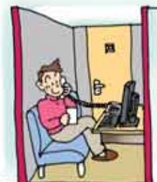
テレフォンクラブ