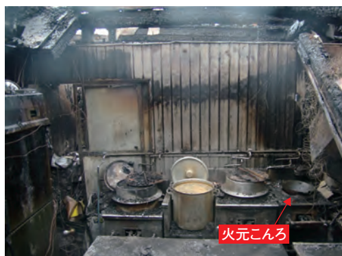
火災後のこんろ周り

設備又は器具(防火上有効な措置として総務省令で定める措置が講じられたものを除く。)を設けた小規模飲食店等における初期消火を確実に実施し、火災の拡大を防止するための措置として消火器具の設置を義務付けるとともに、消火器具の設置義務が免除される防火上有効な措置