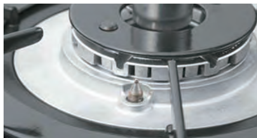
立ち消え防止安全装置