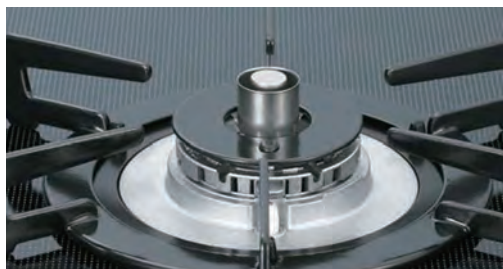
調理油過熱防止装置

自動消火装置とは、「対象火気設備等の位置、構造及び管理並びに対象火気器具等の取扱いに関する条例の制定に関する基準を定める省令」（平成14年総務省令第24号）第11条第7号に規定するもののうち、火を使用する設備又は器具を防護対象物（自動消火装置によって消火すべき対象物をいう。）とし、当該部分の火災を自動的に感知し、消火薬剤を放出して火を消す装置をいい、このような装置を設けた火を使用する設備又は器具を使用する小規模飲食店等においては、消火器具の設置義務が課せられないことになる。