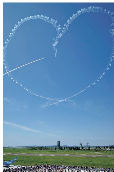
東松島市ブルーインパルス飛行訓練

当該事案は、違反事項の改修まで滞りなく進捗したものであるが、ここで担当者の所感を紹介する。「違反処理の事務手続きは実例やサポート体制があり難しくはなかった。しかし相手と直接やり取りするのは原則担当者のみであり、接遇が非常に難しい。納得して改修してもらうには、いかに寄り添い好印象を抱いてもらうかが重要と感じた」とのことであった。これは当地区のような地方都市が行う違反処理の本質ではないだろうか。地方都市ならではの関係者との距離の近さがあるからこそ、行政指導で改修する、若しくは一歩踏み込めない現状がある、と先