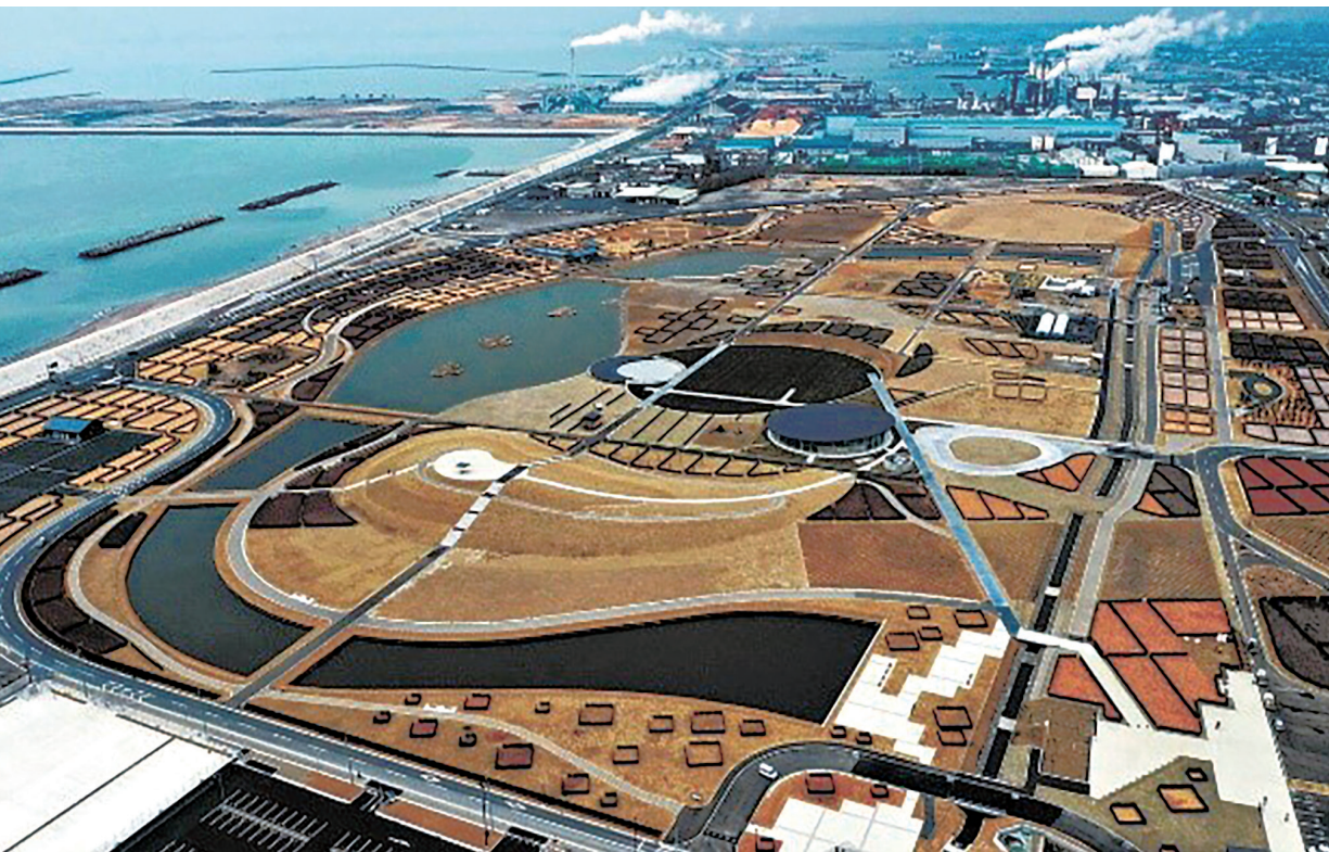
津波復興祈念公園