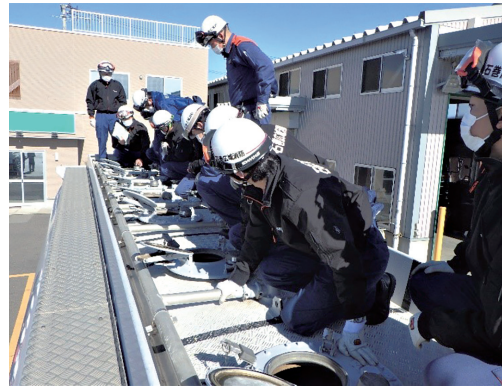
危険物施設における教養研修会

め、経験不足の若手職員が増えており、予防業務に精通した職員の育成は急務となっている。このため各種研修会を企画立案し試行錯誤しながらも若手職員の人材育成に力を入れているところである。