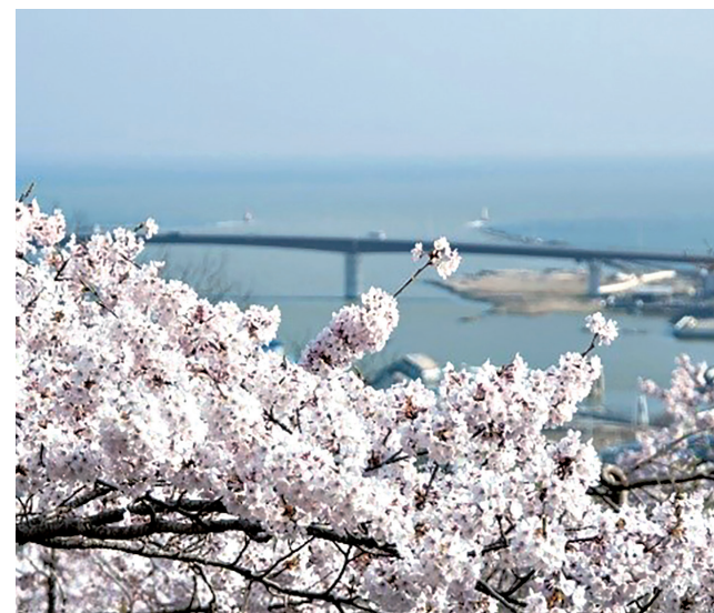
石巻市日和山から太平洋を望む

述したが、距離の近さがあるからこそ違反是正に納得してもらい改修に導くことが可能であり、その際に重要なのは簡単ではあるが「聴く」ことなのかなと感じている。人材育成分野などでもよく言われるが、自発的な行動を促すためにはまずは聴くこと、つまり傾聴することから始まるとされ、これはあらゆる分野の接遇において非常に重要な要素である。