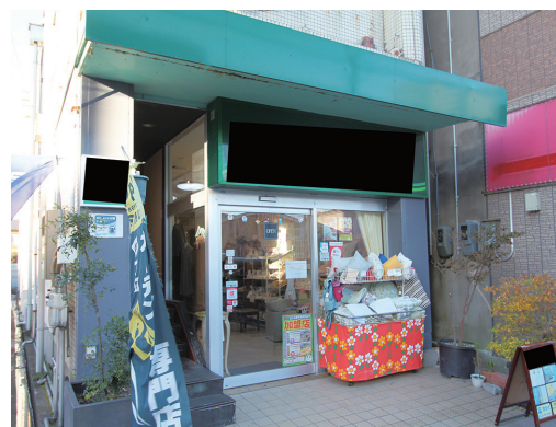
重大な消防法令違反の公表事例(若手職員が主担当となった事例)

「違反処理業務は取り掛かったら違反是正が完了するまで手を休めることなく動くしかありません。違反処理過程で起きる問題、不明点は、必ず解決できます。まずは着手し、関係者の声を聴きましょう。全てはそこから始まります。」