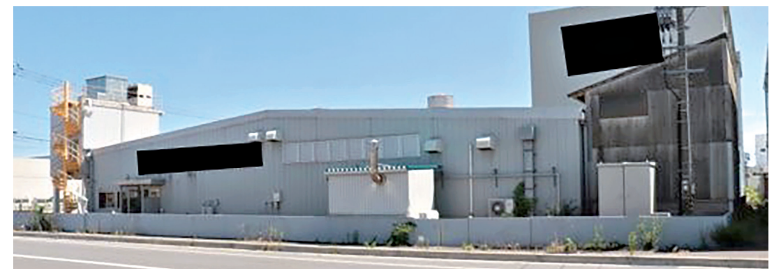
消防用設備等設置命令発出事例(研修持ち込み事例)

次に小職が隔日勤務をしていた際に管轄内で実際にあった事例を紹介する。これまで当組合消防本部では、違反処理の主担当は主任以上であることが慣習となっていたが、この事例については若手消防士を主担当として違反是正に取り組んだものである。主担当に任命した職員は予防業務歴5年の元甲子園球児であり、現在では救助隊員として活躍し救助大会では個人種目で全国大会に出場するようなバリバリの体育会系の職員である。小職を含め周囲のサポートは万全を期し、人材育成はもちろん、当組合消防本部内でのモデルケースになるよう考慮し取り掛