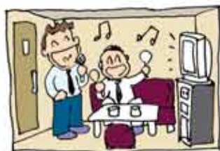
カラオケボックス