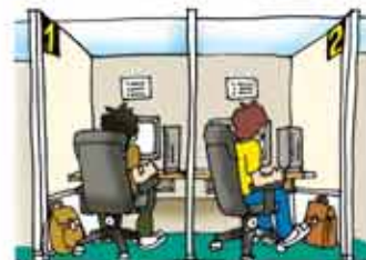
インターネットカフェ