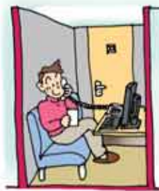
テレフォンクラブ