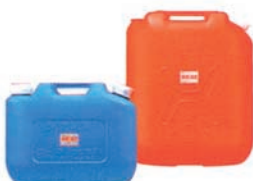
灯油用ポリエチレン缶