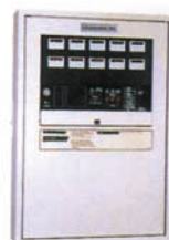
自動火災報知設備 受信機